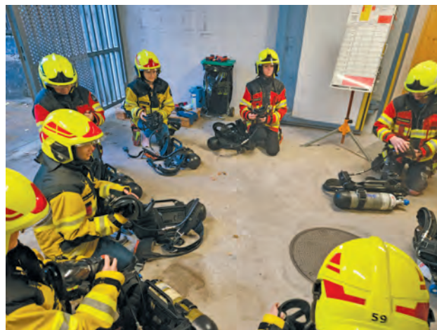
Ausbildung am Atemschutzgerät und Vorbereitung auf den anschliessenden Parcours in einem mit Disconebl simuliert verrauchten Raum.