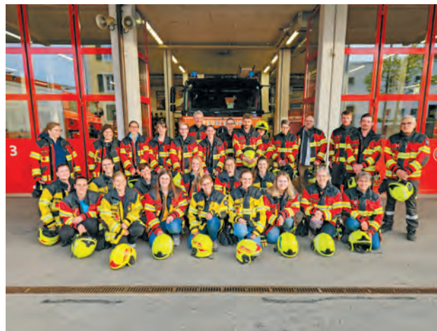
Ein grosses Dankeschön an unsere Partnerinnen und Partner sowie unsere Angehörigen für ihre Unterstützung, ihr Verständnis und ihren Rückhalt im Hintergrund!

Wer mehr über die Feuerwehr erfahren und sich eine aktive Mitarbeit vorstellen kann, ist herzlich willkommen.